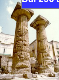
Fotografie da articoli di Roberto Ferretti

TARANTO Colonia spartana aveva raggiunto il massimo splendore dal 400 al 350 a.C. sotto lo stratego e filosofo pitagorico Archita 302 a.C. trattato di Taranto con Roma 282 a.C. Roma viola il trattato: fornisce aiuti militari a Turi (sotto Taranto) ed entra nelle acque di Taranto con una squadra Taranto affonda alcune delle 10 navi di Roma