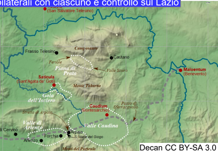
Decan CC BY-SA 3.0

321 Forche caudine Sconfitta e umiliazione → Roma aumenta le legioni e le organizza in manipoli → accerchiamento: alleanze (Apuli, Marsi, Peligni) e colonie → Via Appia (Roma-Capua in seguito Brindisi) Vittorie e sconfitte – Nel 304 a.C. i Sanniti chiesero la pace